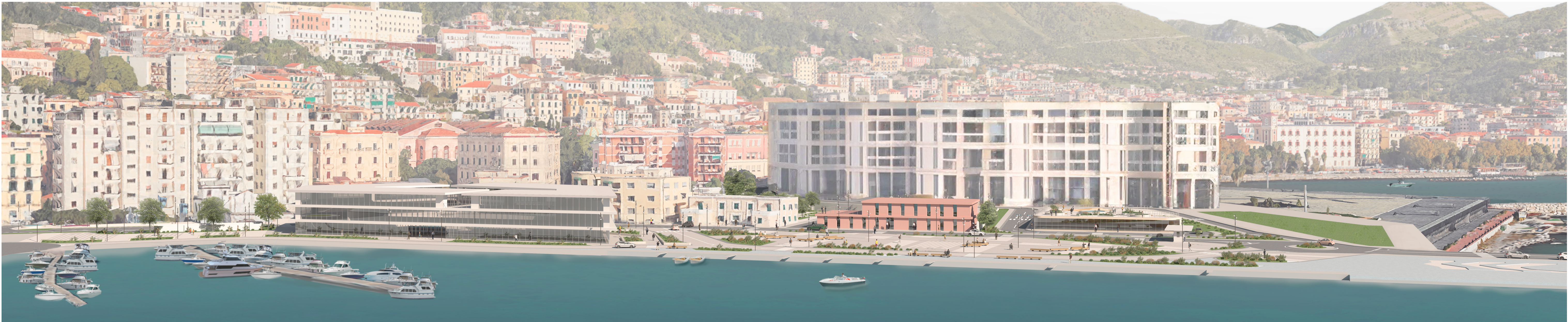
Veduta dell'intervento dal mare