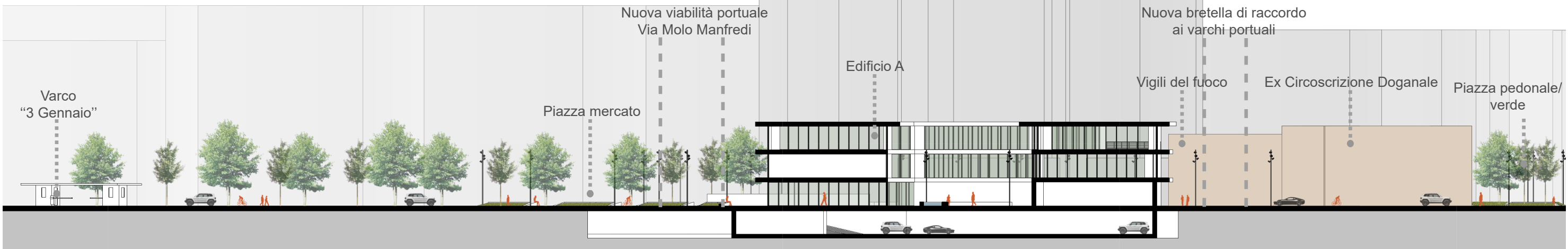
Sezione A - A 1:500