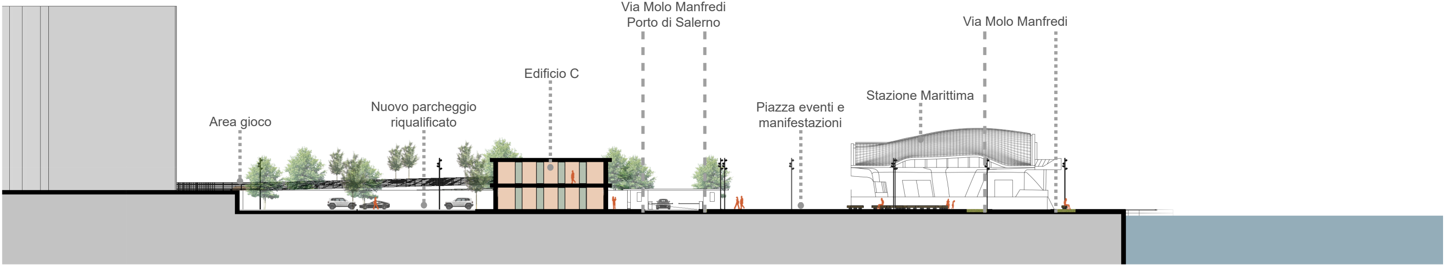
Sezione D - D 1:500